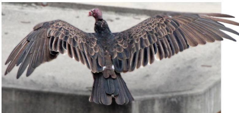
Urubu à tête rouge (charognard), 2024