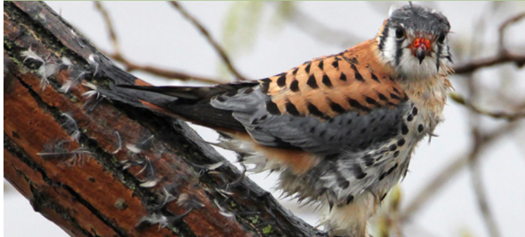
Crécerelle d'Amérique, 2023

Depuis mon arrivée aux Philanthropes en septembre 2022, j'ai le plus grand bonheur d'observer des oiseaux de proie depuis mon balcon ! C. Mather