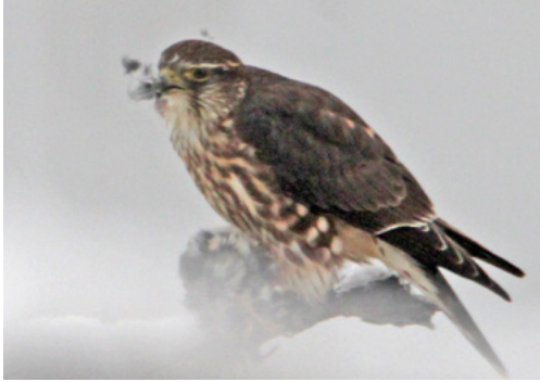
Faucon émerillon, 2022