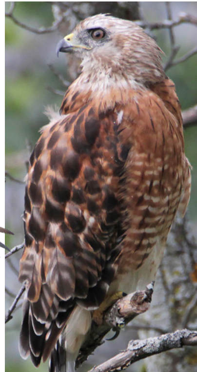
Buse à épaulettes, 2024