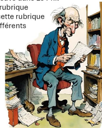
Notre éditeur en pleine lecture de vos commentaires.

Alors, à vos plumes, heu ! À vos ordinateurs et au plaisir de vous lire dans Le Phil d'avril.