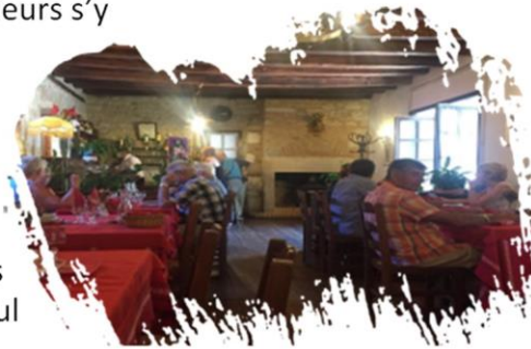
Au restaurant La Terrasse, ce soir, le repas offert : la daube, accompagnée d'un vin du pays, à volonté.